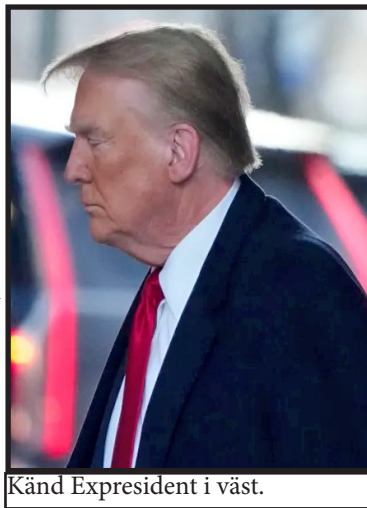
Känd Expresident i väst.

2. Här i Turkiet har vi en helvetes hög ränta, i synnerhet på mina sparkonton. Det har jag bestämt sedan lång tid tillbaka, flera gånger. Jag har nyligen höjt min utlåningsränta, eftersom jag lånat penkki till min kompis Domald Trump. Han behövde ett tillskott till återkomsten för presedentskapet.