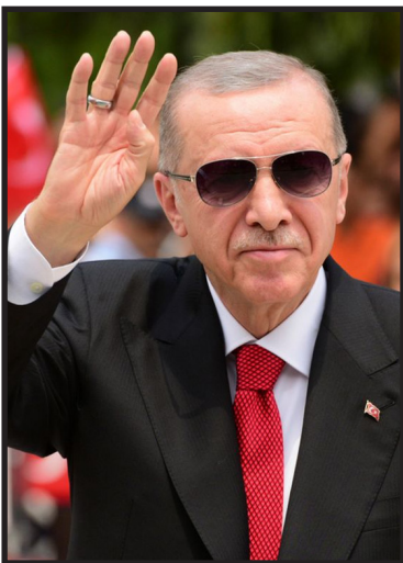
Recep Tayyip Erdoğan Natoförhandlare och boss i Turkland.